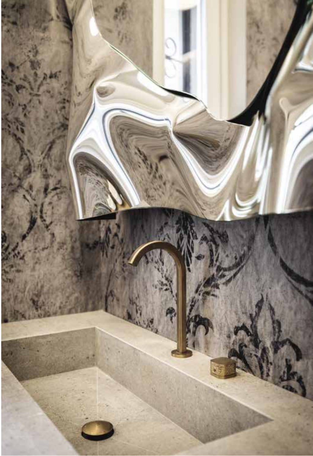
Modernità, eleganza e un tocco artistico per questo bagno dove i diversi materiali vengono accostati e combinati tra loro per dare origine a soluzioni alternative e ricercate ( Far Arreda ).

Far Arreda Fornitura arredi via Martiri della Libertà 23, Roncadelle Bs tel 030 2780270 fararredamenti.com