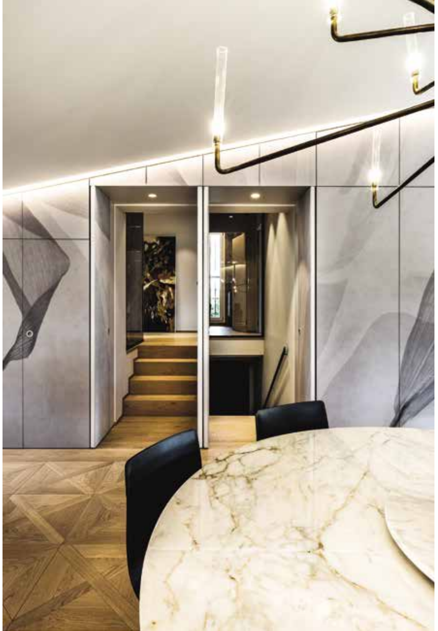
La cantina dei vini rappresenta idealmente il cuore pulsante del progetto d'interni, realizzata completamente custom da Far Arreda ha dato nuova vita a una zona considerata abitualmente di passaggio diventando invece punto di incontro e motivo di sosta.